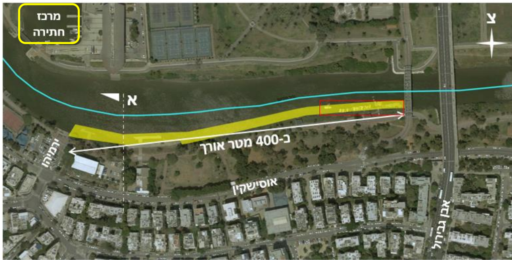
תצ"א- קטע נחל לפינוי משקעים בקרקעית

לתיאור מסגרת ומהות העבודה: חפירה ופינוי של משקעים מהגדה השמאלית בקטע הירקון אוסישקין