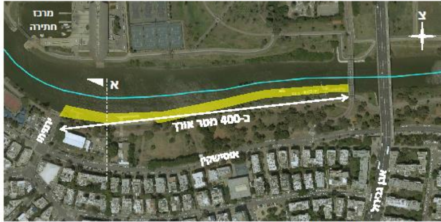
תצ"א- קטע נחל לפינוי משקעים בקרקעית

לתיאור מסגרת ומהות העבודה: חפירה ופינוי של משקעים מהגדה השמאלית בקטע הירקון אוסישקין