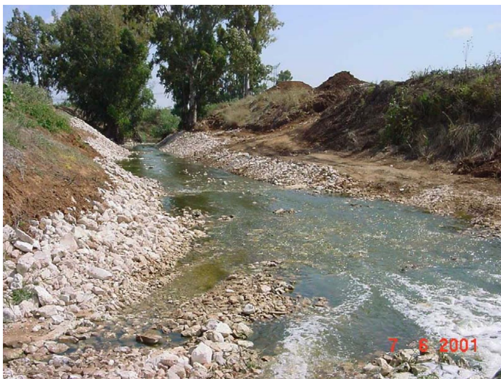
נחל קנה לפני החיבור עם נחל הירקון