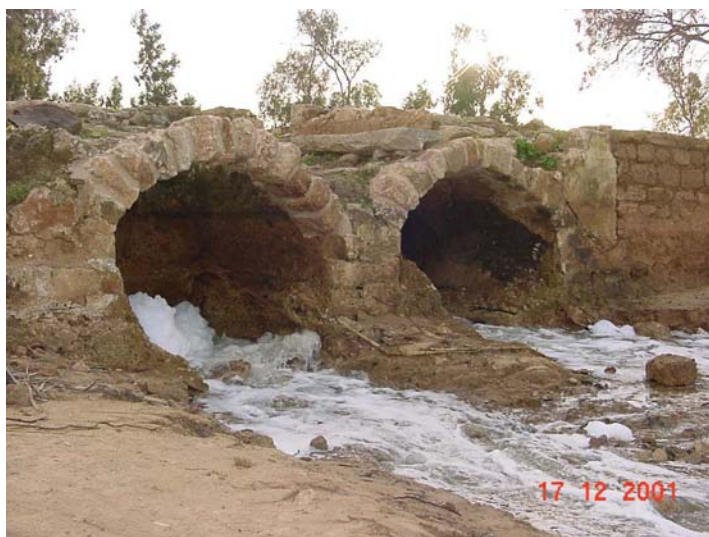
שבע טחנות הזרמת מים

נפילת עץ אקליפטוס – במהלך הסופה, בתחילת חודש דצמבר 2001, נפל עץ אקליפטוס גדול צמוד לגשר של כביש 40 לנחל וחסם את אחד הנתיבים לכיוון צפון. העץ סולק מהמקום ופונה מאזור האפיק כדי למנוע את סחיפתו לנחל.